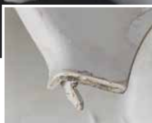
清洁过程中：使用肯天® MC1718后从模具中拉出重度污染残留物的零件