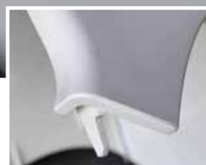
清洁后：使用肯天® MC1718清洗模具后的零件