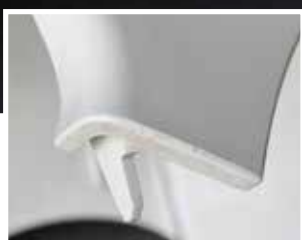
清洁前：模具残留物造成的零件污染